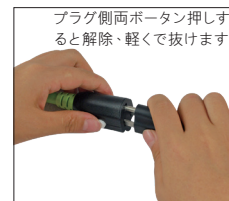
プラグ側両ボタン押しすると解除、軽くて抜けます