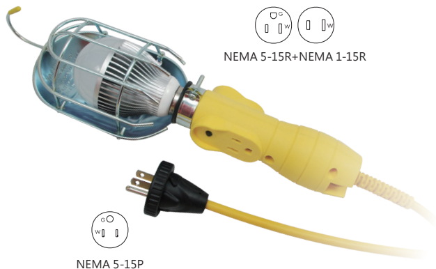
NEMA 5-15R+NEMA 1-15R